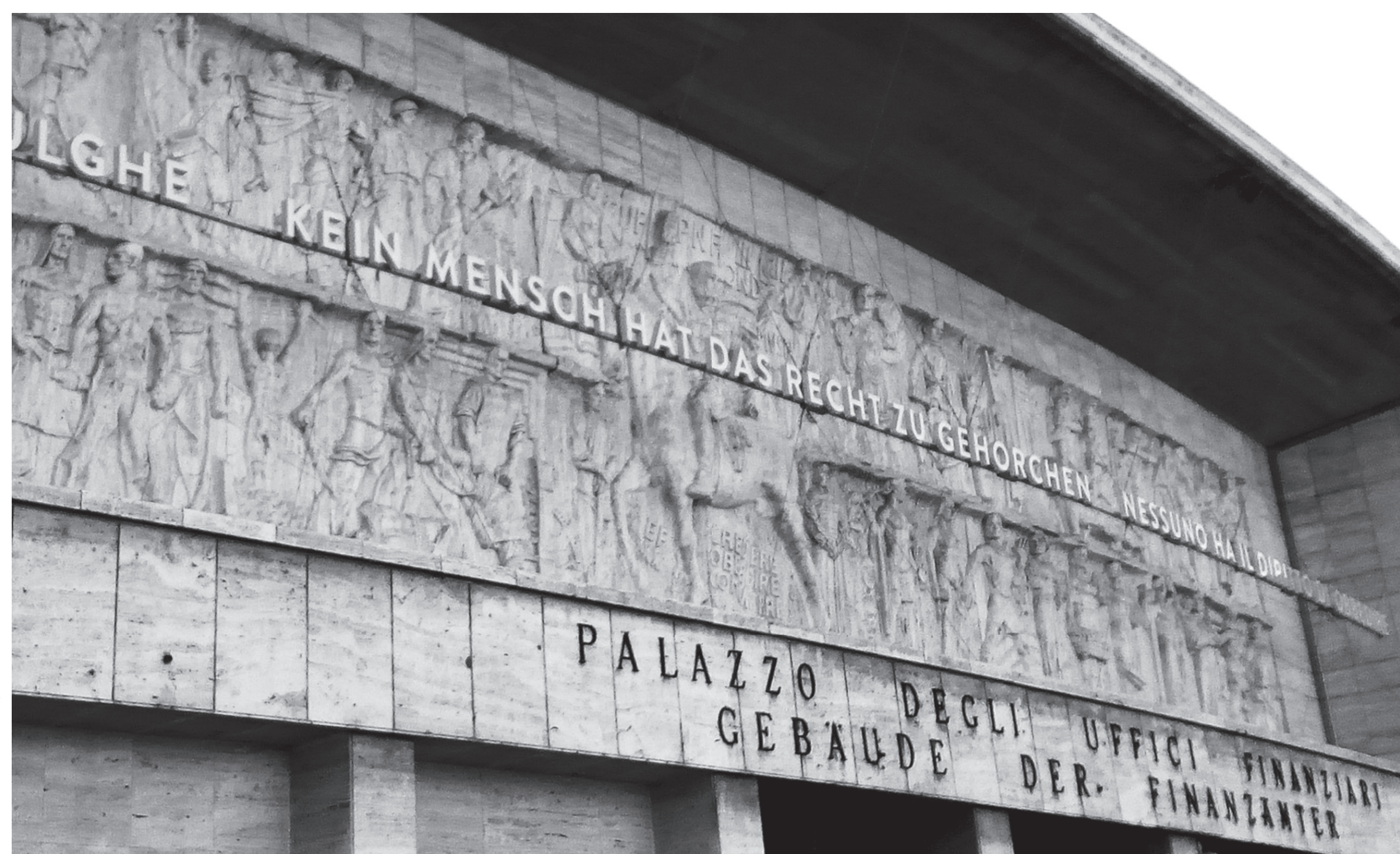
Mussolini-Relief am Gerichtplatz in Bozen / Bassonilievo di Mussolini in Piazza Tribunale a Bolzano

gefördert von Stiftung Fondazione Sparkasse sostenuto da